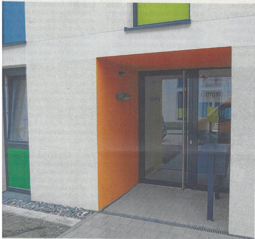
Im Jahr 2013 wurde mit dem ersten Bauabschnitt begonnen, bei der Baugenossenschaft rechnet man mit der Fertigstellung des dritten und letzten Bauabschnitts bis Mitte 2018.