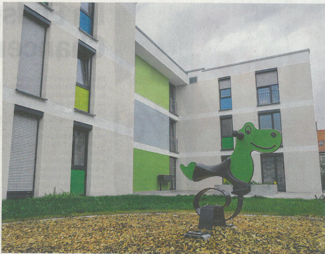
Innenstadtnah und doch im Grünen wohnen. Das bietet das Warenburgareal am Rande der Villingener Südstadt, das derzeit von der Villingener Baugenossenschaft bebaut wird. Nach der Fertigstellung aller drei Bauabschnitte stehen Wohnungen für 125 Familien bereit.

Der zweite Bauabschnitt des Warenburg Areals, der jetzt vor seiner Fertigstellung steht, bietet 51 attraktive Wohnungen mit einer gesamten Wohnfläche von rund 3500 Quadratmetern, 42 Stellplätze in der integrierten Tiefgarage sowie zusätzlich 17 oberirdische Stellplätze.