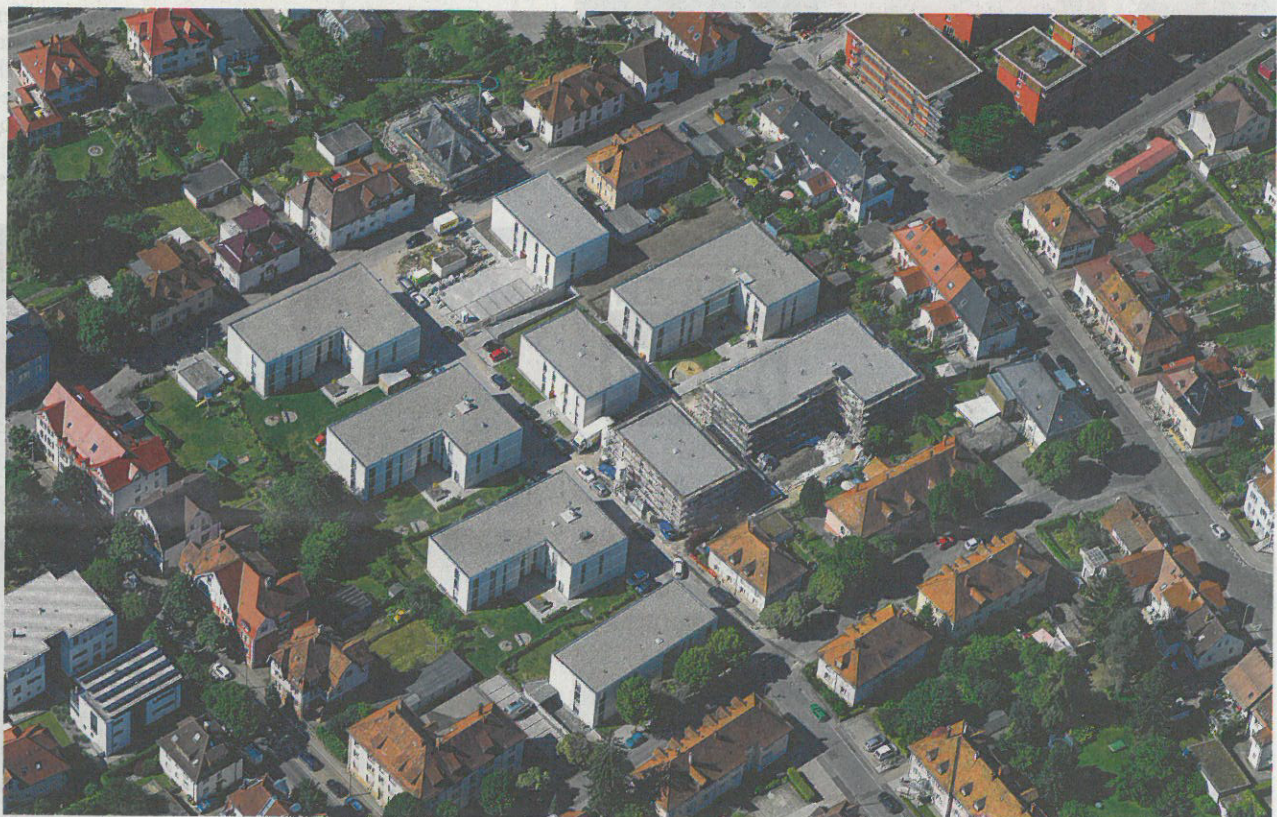
Dieses Luftbild zeigt die Ausmaße der Warenburgbebauung. Rechts verläuft von oben nach unten die Bleichestraße, oben von links nach rechts die Obrist-Aescher-Straße.