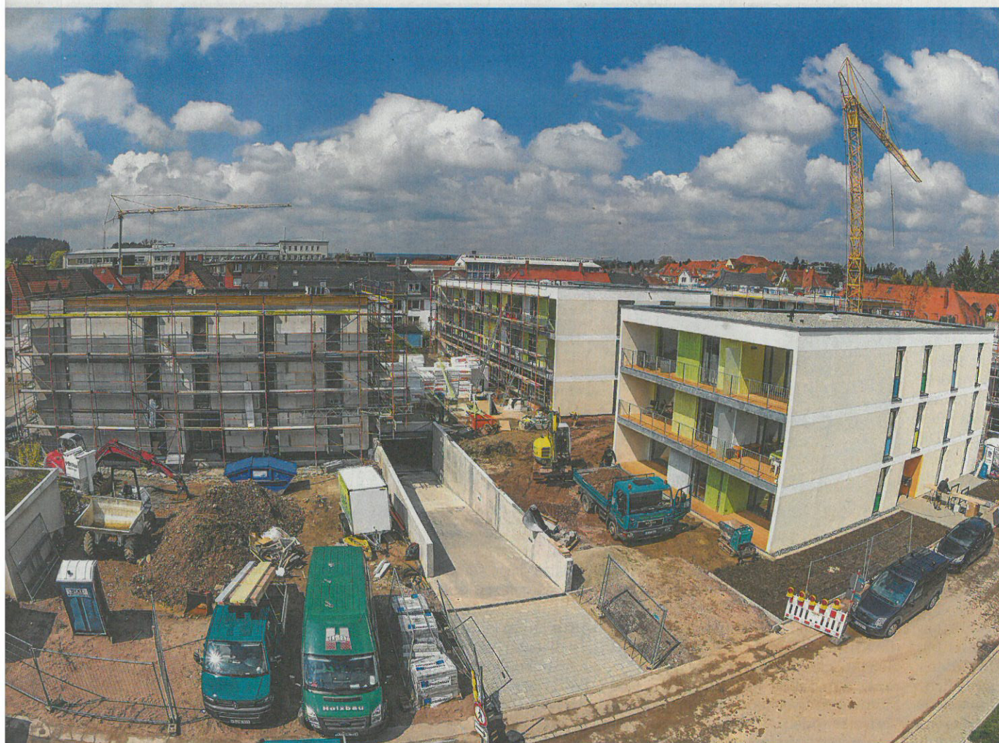
Zwei der Neubauten am Villingen Warenberg werden zur Zeit noch Restarbeiten ausgeführt. Bis Oktober sollen alle 51 Wohnungen des zweiten Bauabschnitts bezogen sein.