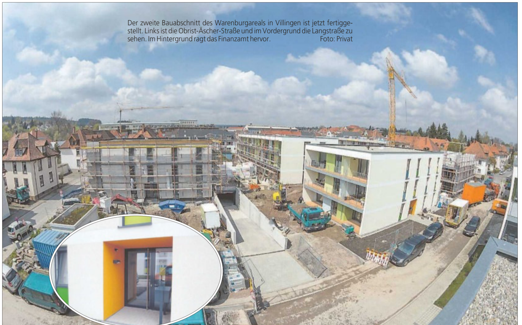
Der zweite Bauabschnitt des Warenburgareals in Villingen ist jetzt fertiggestellt. Links ist die Obrist-Äscher-Straße und im Vordergrund die Langstraße zu sehen. Im Hintergrund ragt das Finanzamt hervor.

Die Neubauten bestehen durch helle und lichtdurchflutete Bauweisen mit großzügigen Glasflächen. Darüber hinaus wurden große überdachte Balkone und Loggien nach Süden und Westen ausgerichtet. Die offenen Grundrisse bieten barrierearme Zugänge zu den Wohnungen ➔