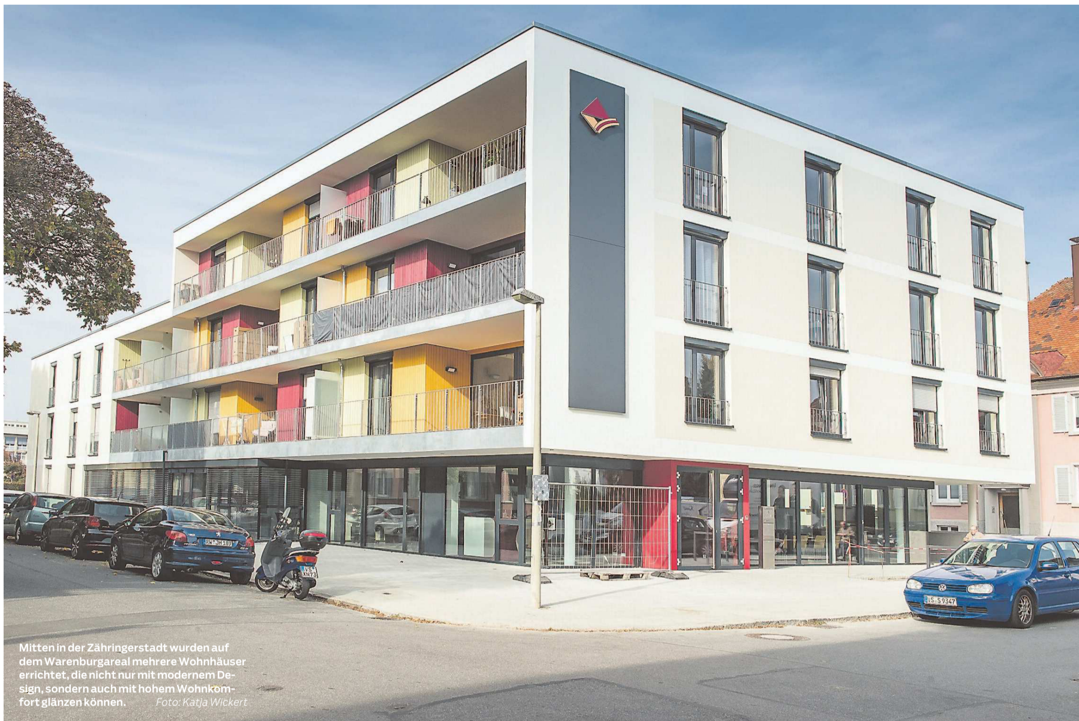
Mitten in der Zähringerstadt wurden auf dem Warenburgareal mehrere Wohnhäuser errichtet, die nicht nur mit modernem Design, sondern auch mit hohem Wohnkomfort glänzen können.