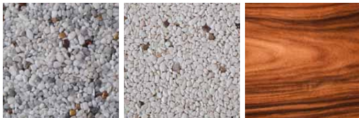
Holz Hellgrau Holz Cremefarben