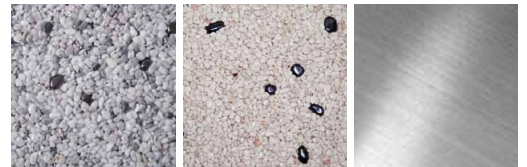
Metall Hellgrau Metall Cremefarben