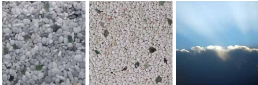
Luft Hellgrau Luft Cremefarben