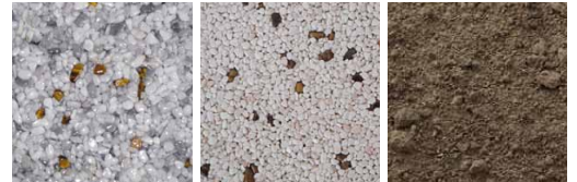
Erde Hellgrau Erde Cremefarben